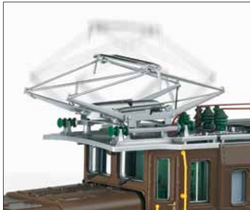
Motorisch heb- und senkbare Stromabnehmer

Zusammen mit den neuen Personenwagen 31522 und 31522 sowie dem neuen Gepäckwagen 34553 kann ein typischer Personenzug der RhB aus den 60er-Jahren nachgebildet werden.